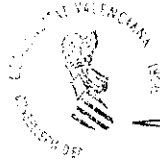
Mª José Català Verdet

LA CONSELLERA D'EDUCACIÓ, CULTURA I ESPORT